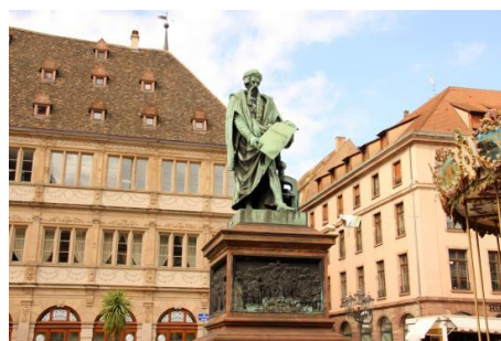
ゲーテンベルクの彫像がある広場