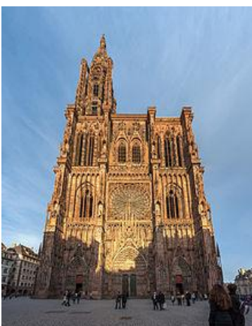
ストラスブール大聖堂

私が、豊中 RC にお世話になった 6 か月、皆様のお蔭で勉強に打ち込むことができ、理学博士の学位を取得できましたことを心よりお礼申し上げます。これから、できましたら日本で就職し、日本に貢献できるよう努力していきます。本当にありがとうございました。