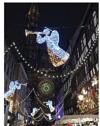
ストラスブール大聖堂前のクリスマスデコレーション