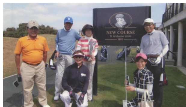
St Andrews (THE NEW COURSE)