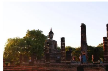
ワット・マハタート (スコータイ歴史公園内)

シーサンウォン・スコータイ病院は隣接する 19 の医療機関を束ねる総合病院です。24 時間体制で 65 人の医師が配置されており、307 床のベッド数を持ちます。