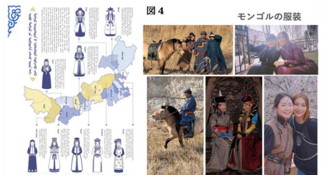
図4 モンゴルの服装