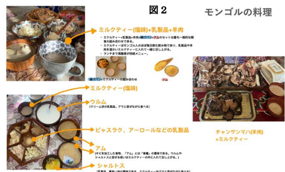
図2 モンゴルの料理