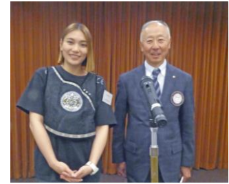
A JISAIHAN 船橋輝夫会員

自己紹介を交えながら、私の故郷である内モンゴルに関する食文化、生活文化、そしてモンゴル族の文化について紹介しました。